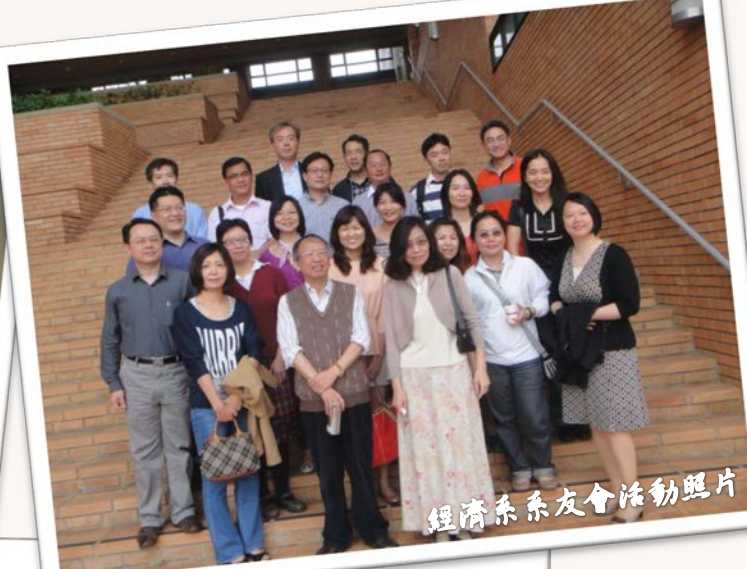
經濟系系友會活動照片