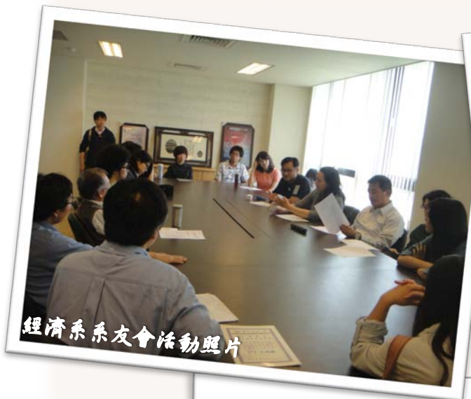
經濟系系友會活動照片