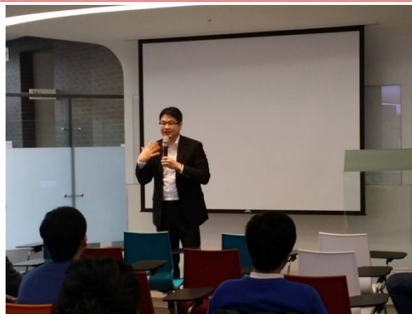
104/02/07 「閱讀經濟講座活動」